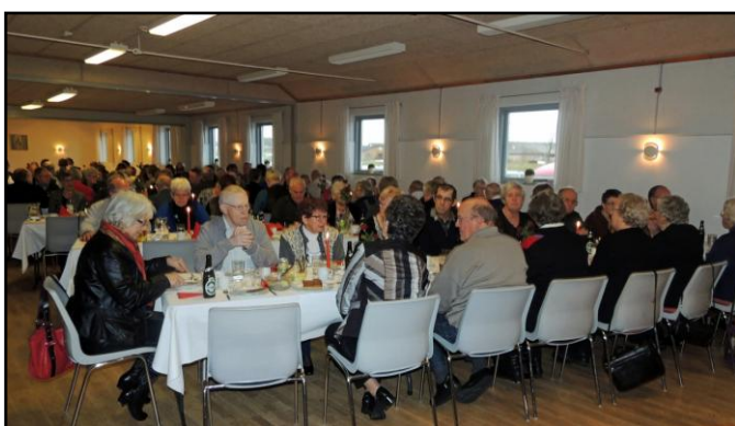
Mygdal Forsamlingshus 30/12 2012

Tilbage er vist kun at ønske tillykke med 100 års jubilæet og ønske en god fremtid for Mygdal Forsamlingshus, og alle dets brugere.”