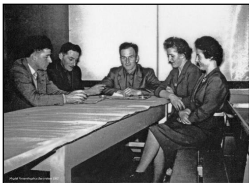
Forsamlingshusets bestyrelse i jubilæumsåret 1962.