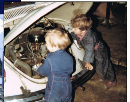
( De nye ejere er startet tidligt, her omkring 1982)

Det vil glæde os at fejre denne dag sammen med gamle og nye kunder, familie og venner, kollegaer og samarbejdspartnere