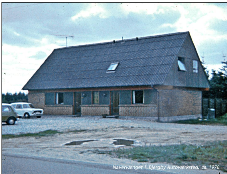
Navervænget 1, Bjergby Autoværksted, ca. 1978