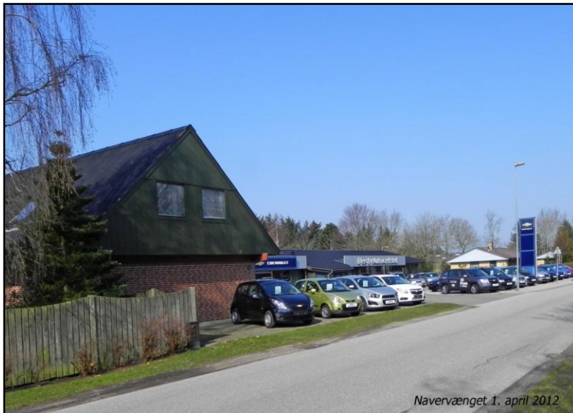
Navervænget 1. april 2012