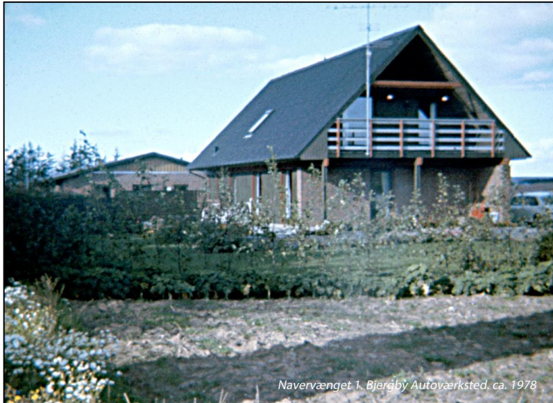
Navervænget 1, Bjergby Autoværksted, ca. 1978