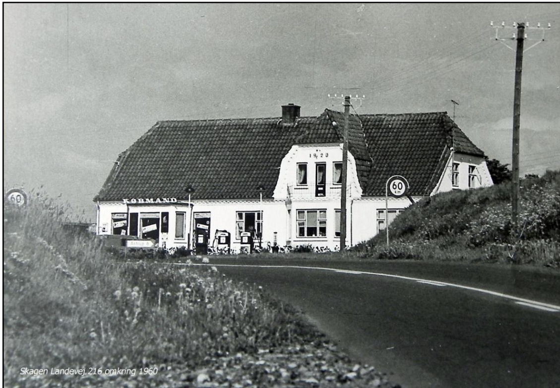
Skagen Landevej 216 omkring 1960