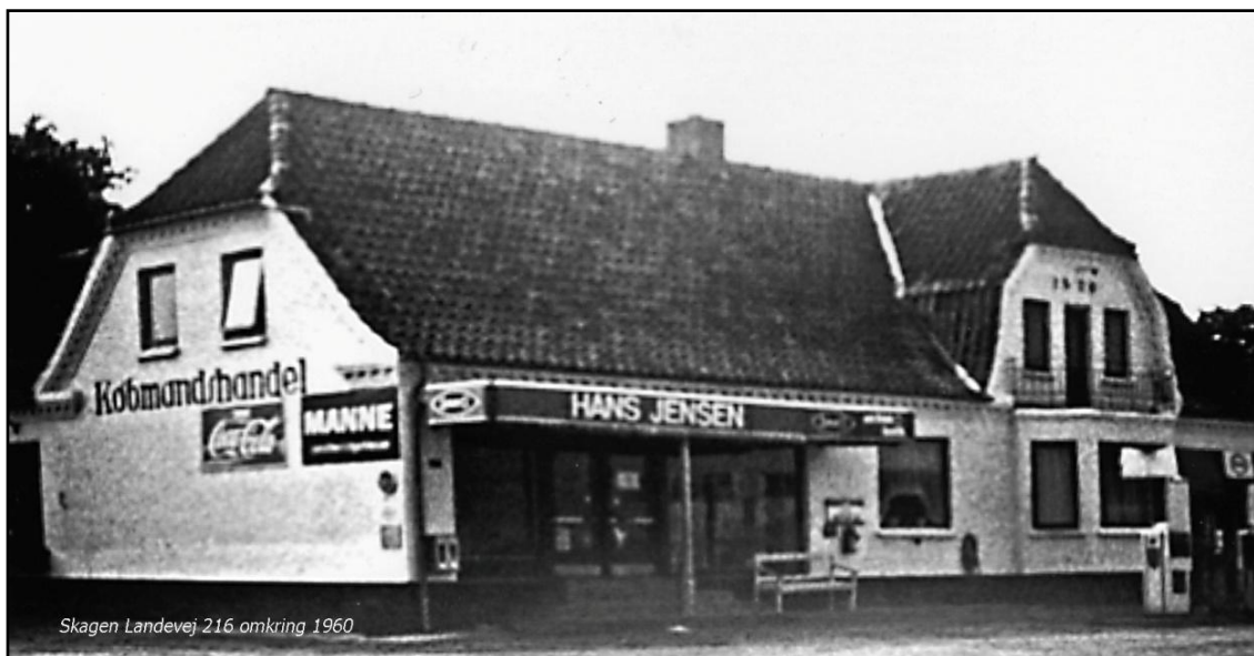
Skagen Landevej 216 omkring 1960